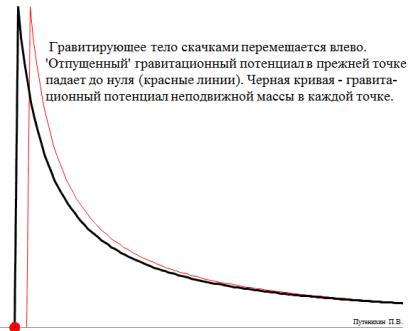
Рис.2 Изменение гравитационного потенциала при скачкообразном движении Солнца

Можно догадаться, что каждое изменение потенциала будет происходить в зависимости как от скорости распространения потенциала – скорости света, так и от скорости, с какой Солнце удаляется от исходного положения. То есть, о новом положении Солнца в каждой точке пространства будет известно не сразу, а через время, необходимое, чтобы это изменение достигло этой точки. Получается, что изменение потенциала, его «движение» будет происходить со скоростью удаления Солнца, но при этом с некоторой задержкой, связанной с ограниченной скоростью его распространения – скоростью света.