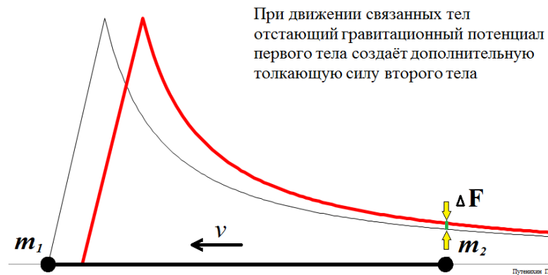
Рис.4. Массы на концах движущегося стержня испытывают неуравновешенную силу, превышающую силу их гравитационного притяжения в состоянии покоя.

Выходит, что стержень под воздействием этих неожиданных сил начнёт ускоряться. Причём, из состояния покоя стержень сам в движение не придёт, ему необходимо дать некоторую начальную скорость вдоль его оси.